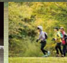
毎年秋には本格的な山岳コース を走破する「トレイルラン カムイ シリ」が開催されます。