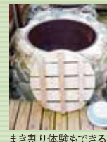
まき割り体験もできる 五右衛門風呂