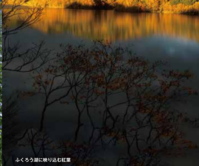
ふくろう湖に映り込む紅葉