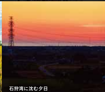
石狩湾に沈む夕日