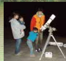
澄んだ空気と静かな森の中 で、夜空いっぱいに広がる星を 観察できます。