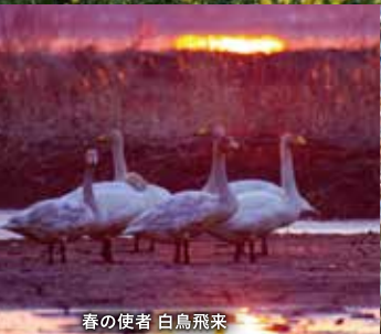
春の使者 白鳥飛来