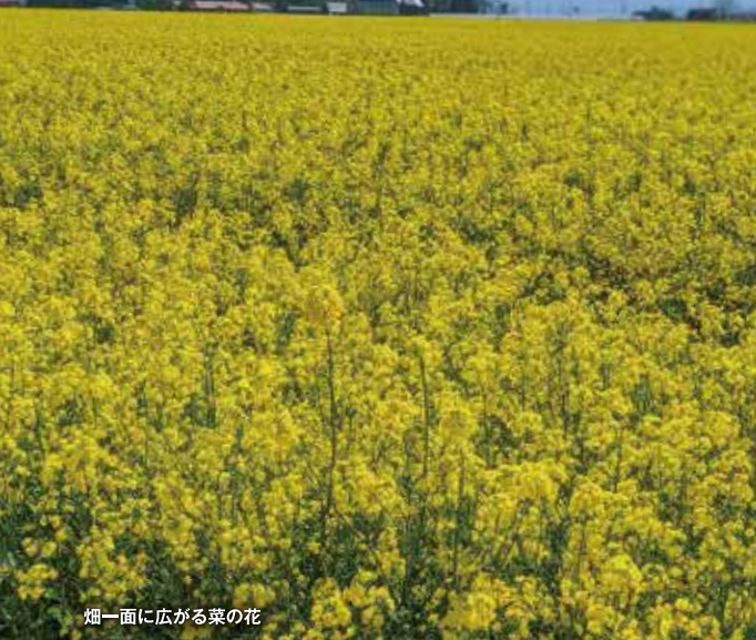
畑一面に広がる菜の花