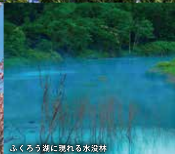
ふくろう湖に現れる水没林