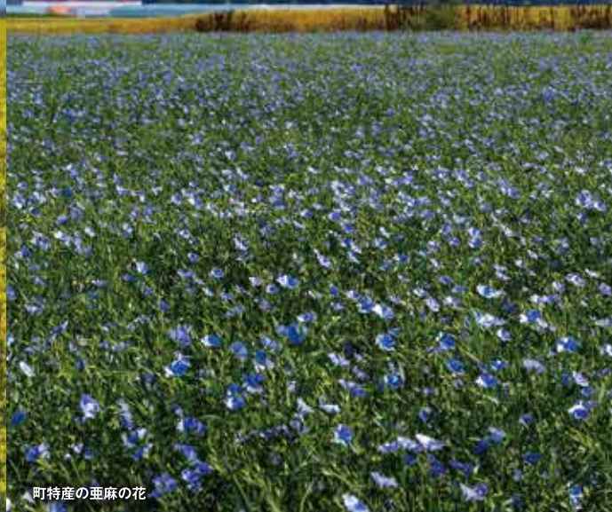
町特産の亜麻の花