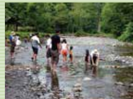
川遊びも楽しめます。