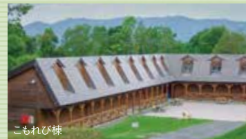
こもれび棟 部屋は全てロフトタイプのコテージ