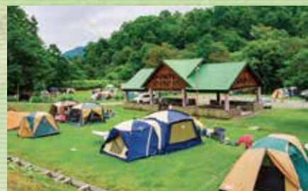
自然体験キャンプ場とバーベキューハウス