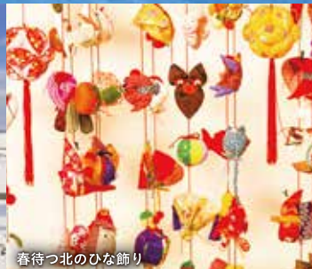
春待つ北のひな飾り