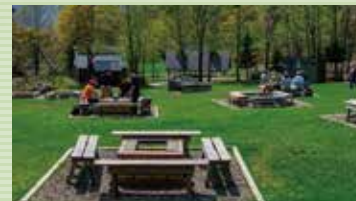
広々としたバーベキュー広場